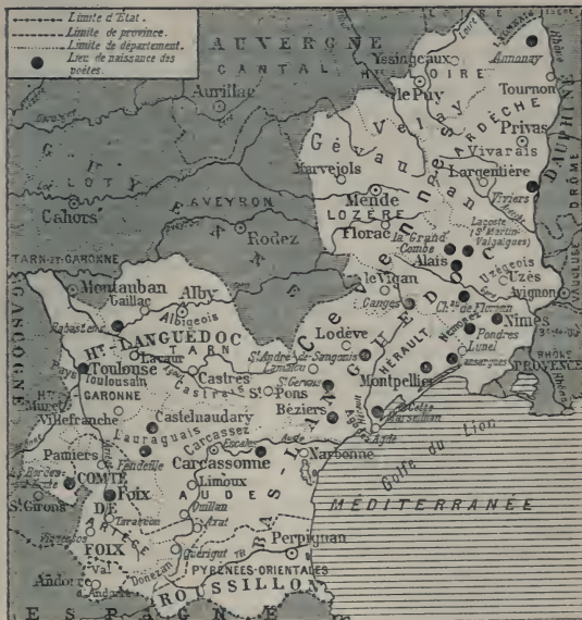
LANGUEDOC ET COMTÉ DE FOIX

elle vraiment la capitale de l'esprit languedocien. N'aurait-elle connu que Goudelin, qu'elle demeurerait prépondérante dans l'histoire littéraire des dialectes du midi de la France. Ce n'est point trop dire que Goudelin fut le frère de Malherbe, comme innovateur, et aussi son égal pour la correction et la qualité du